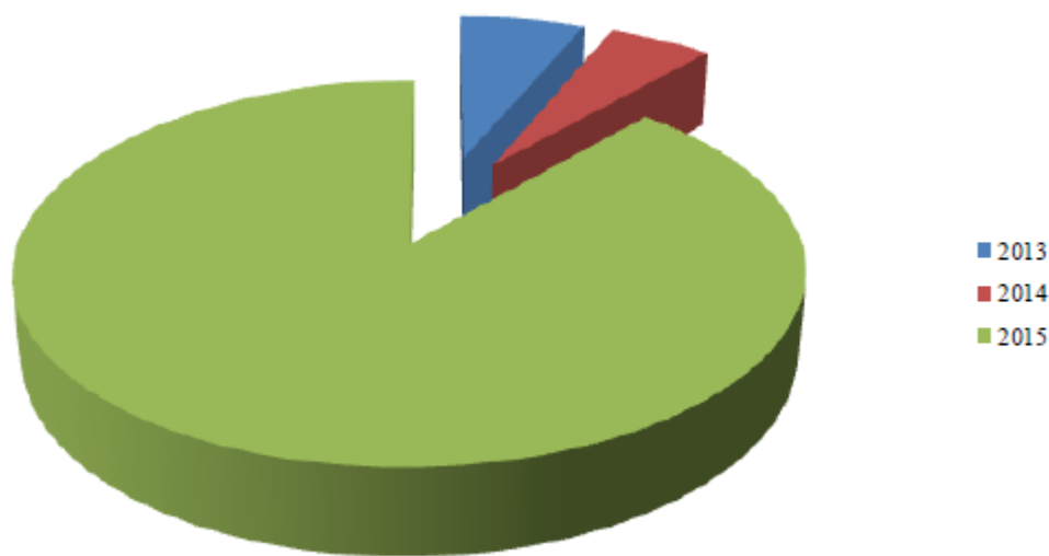
Рисунок 2 - Состав и динамика притока денежных средств от инвестиционных операций ООО «Луара», за 2013-2015 гг.тыс. руб.

Состав и динамика притока денежных средств от инвестиционных операций организации за 2013—2015гг. представлены на рисунке 2.